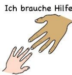
Ich brauche Hilfe

, werden wir euch natürlich gerne dabei helfen